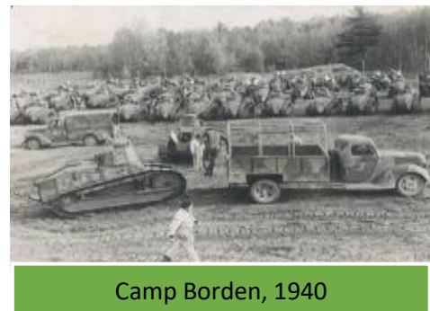
Camp Borden, 1940

In november 1943 wordt hij overgeplaatst naar Camp Borden, Ontario om zijn training te vervolgen. In de bijna vijf maanden die hij hier doorbrengt, met een kort verlof met Kerstmis, haalt hij zijn kwalificatie als Class 3 Driver en rond hij zijn monteursopleiding af en is hij klaar voor dienst overzee.