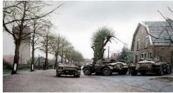
Canadese verkennersseenheid aan de Terborgseweg, 1 april 1945

Pas de volgende middag, maandag 2 april, Tweede Paasdag, is Doetinchem bevrijd.